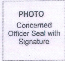
Photo of Candidate

1. Name of Candidate : (IN BLOCK LETTERS) .....